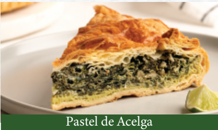
Pastel de Acelga