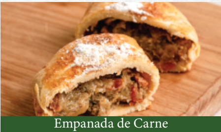
Empanada de Carne