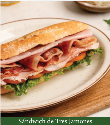
Sándwich de Tres Jamones

Flauta Don Mario s/ 23.90 Mortadela italiana, mozzarella, maasdam, tomate confitado, cebolla caramelizada y lechuga americana. Pan baguette