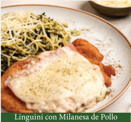
Linguini con Milanesa de Pollo

Por favor, avisarle al mesero si usted tiene alguna alergia alimentaria. Nuestros productos contienen gluten y se elaboran en una planta donde se procesan nueces y derivados.