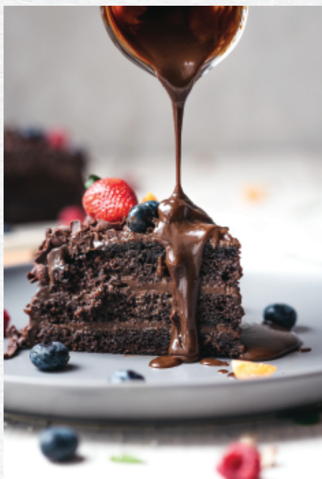
Torta de Chocolate