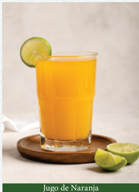
Jugo de Naranja