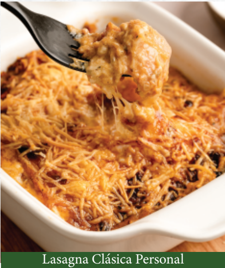
Lasagna Clásica Personal

Por favor, avisarle al mesero si usted tiene alguna alergia alimentaria. Nuestros productos contienen gluten y se elaboran en una planta donde se procesan nueces y derivados.