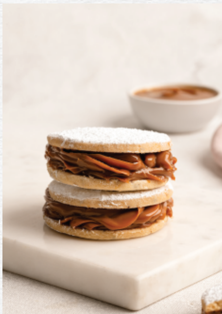
Alfajor de Anís