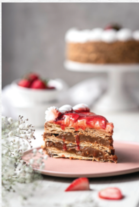
Milhoja de Fresa