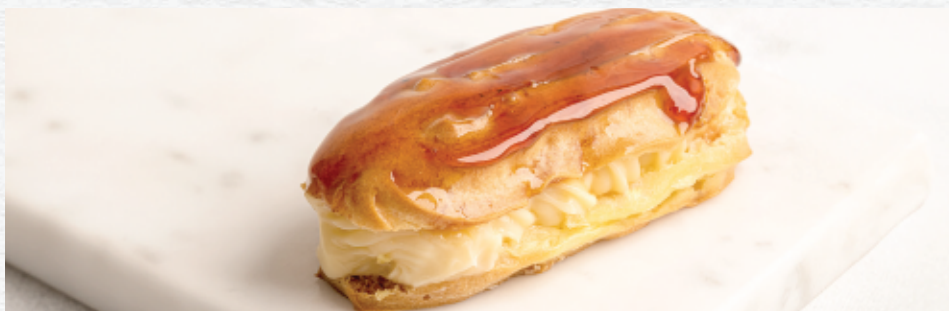
Relámpago de Caramelo con Crema Pastelera